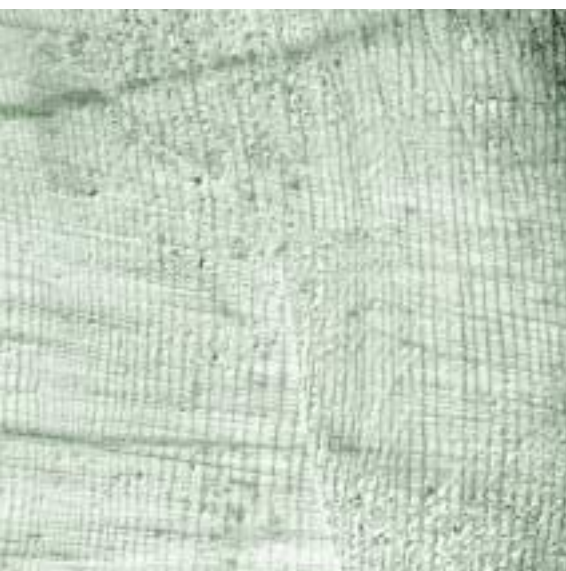
Klangholz-Stamm: langsames und regelmässiges Wachstum

Entgegen anderslautenden Meinungen findet man die Klangfichten nicht nur in den Primärwäldern, auch nicht einzig in eng bewachsenen Beständen und auch nicht nur in Plenterwäldern, sondern in all diesen Waldstrukturen. Das seit Jahrhunderten traditionell verwendete Fichtenholz stammt aus den Gebirgswäldern