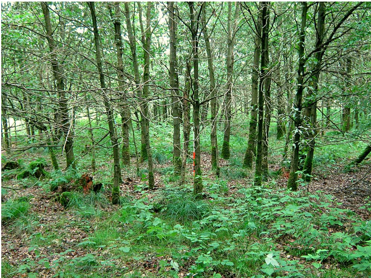
Abbildung 3. 20jähriger Eichentrupp im FoR Schwarzenborn Nord (Hessen)

In den aus größeren Eichen angelegten Trupps blieb die Clusterstruktur lange erhalten (Abb. 3). Ausschlaggebend dürften dafür die größeren ursprünglichen Abstände zwischen den Pflanzen sowie die Individuen der dienenden Baumart sein. Hierdurch kam es zu einer ähnlichen Wachstumsdynamik wie in den Reihenaufforstungen. Im Gegensatz zu den Nestern hatte in den Trupps der Einfluss benachbarter Eichen keine negativen Auswirkungen auf die Überlebensrate und Durchmesserentwicklung und somit auch nicht auf die Stabilität der in Trupps erwachsenen Eichen. Gleichzeitig förderte die innerartliche Konkurrenz die Qualitätsentwicklung. Dies resultierte vor allem in einer vergleichsweise hohen Anzahl an potenziellen Z-Bäumen [3, 16, 22].