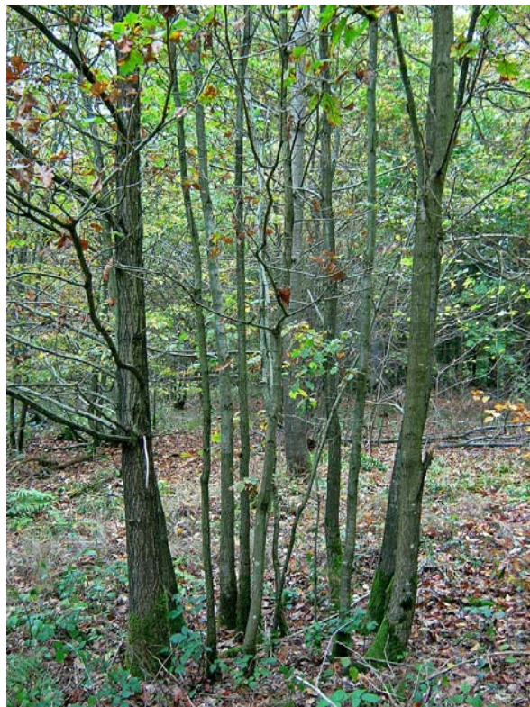
Abbildung 2. 22-jähriges Eichennest im FoR Königheim (Baden-Württemberg).

In den aus kleinen Pflanzen angelegten Eichennestern führte die enge Begründung früh zu sehr hoher Mortalität sowie geringem Durchmesserwachstum und daher zu geringer Stabilität der Eichen. Fallstudien haben bestätigt, dass randständige Eichen von Nestern tatsächlich oftmals die vitalsten innerhalb dieser Cluster sind [09, 15]. Durch die verringerte Anzahl an Nachbarn und die nicht vorhandenen „dienenden“ Baumarten sind es diese Außenbäume, die den hohen intraspezifischen Konkurrenzdruck überstehen. Dabei bilden sie allerdings zugleich stark einseitige, schlechte Kronenformen aus (Abb. 2). Zwangsläufig führt dies zu einer eingeschränkten Astreinigung sowie unbefriedigender Ausbildung der Stammachse und damit zu signifikant weniger Z-Baum Anwärttern.