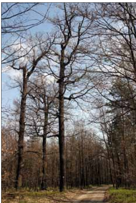
Fig. 3: Old Sessile Oak trees "Urwald Weißwasser"

Die beschriebenen Bestände der Traubeneiche, Waldkiefer und Lausitzer Tieflandsfichte können auf Grund ihres Alters sowie der bekannten Waldgeschichte mit hoher Wahrscheinlichkeit als autochthon angesprochen werden [3, 4]. Das bedeutet, dass sich diese Bestände nach der letzten Eiszeit auf den genannten Standorten angesiedelt haben und sich seitdem fortgesetzt unter den gegebenen Standortverhältnissen natürlich verjüngt haben. Dies führte im Laufe ihrer Entwicklungsgeschichte zu einer optimalen Anpassung der Vorkommen an die Klimabedingungen