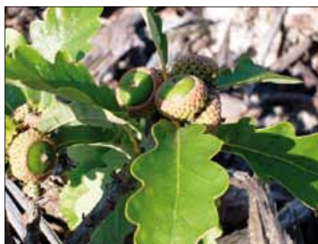
Fig. 5: Acorns observed at the gene conservation seed orchard Nachten

In the first three to four years after planting, the average mortality rate of the sessile oak-gene conservation seed orchard was already 20 %, 11 % of the clones got totally lost. This higher mortality rate compared to the clone collection in Graupa was mainly caused by the extreme conditions on the recultivation site which could not be totally balanced despite various measures like watering in drought periods. Nevertheless, the production of acorns could be observed already at 5 % of the conserved oaks in August 2008 (Figure 5). On one hand, these results confirm the chosen strategy to establish gene conservation seed orchards on one hand. On the other hand, the valuable genetic resources of the Sessile Oak occurrence should be safed by a second gene conservation seed orchard on natural soil to minimize the risk of total loss.