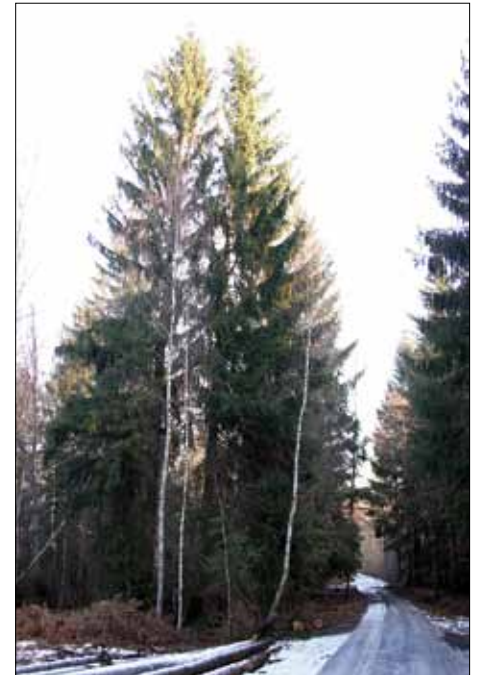
Fig. 4: Old Norway Spruce trees and Birches Abb. 4: Alte Fichten mit Birke

In cooperation with the owner of the forests in the territory situated in front of the lignite open cast mine Nochten, the Vattenfall