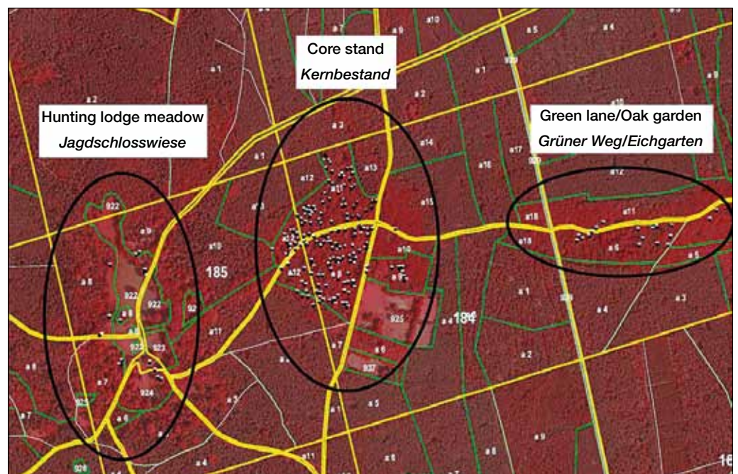
Fig. 6: Subunits of the Sessile Oak occurrence "Urwald Weißwasser" Abb. 6: Teilkollektive des Traubeneichen-vorkommens „Urwald Weißwasser“

Die Ergebnisse der Isoenzymanalysen zeigen für die bereits evaluierten Traubeneichen des Urwaldes Weißwasser im Vergleich zu den beiden Saatguterntebeständen höhere Werte der genetischen Vielfalt und Diversität. Werden die bereits erhaltenen Traubeneichen in die drei geographisch zusammenhängende Teilkollektive Kernbestand – Grüner Weg/Eichgarten – Jagdschlosswiese aufgeteilt (Abbildung 6), weisen die Teilvorkommen Kernbestand und Grüner Weg/Eichgarten ähnliche genetische Strukturen auf. Dagegen ähneln sich die Strukturen des sehr kleinen Teilvor-