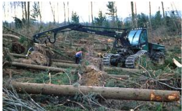
El cumplimiento de la seguridad es primordial en la transformación de la madera.