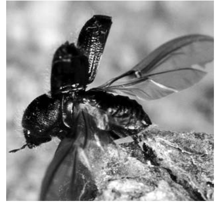
Abb. 3: Nach dem Ausschlüpfen aus der Rinde fliegen die Käfer weg, um neue, befallstaugliche Wirtsbäume zu suchen. (Foto: Beat Wermelinger).

In der Sierra Nevada in Südspanien, breitet sich der Pinienprozessionsspinner ( Thaumetopoea pityocampa ), ein nadelfressender Schmetterling, zunehmend in höhere Lagen aus und bedrängt die Reliktvorkommen der Waldföhre ( Pinus sylvestris ). Im