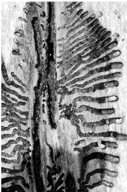
Abb. 1: Von den längsgerichteten Muttergängen zweigen die Larvengänge seitwärts ab. (Foto: Beat Wermelinger).

Laut einer neuen Studie (Requardt et al. 2007) stellen Insekten die grösste Bedrohung der Wälder Europas dar, noch vor Stürmen und Feuer. Auch in den USA gelten Insekten und Pathogene als die wichtigsten Störungsfaktoren. Während die Bilder von wütenden Waldbränden wie z.B. in Kalifornien