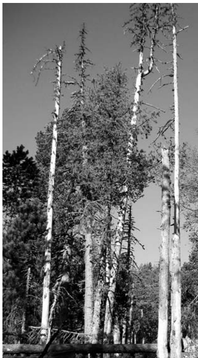
Abb. 4: Im Rorwald bei Giswil OW starben zahlreiche Aufrechte Bergföhren nach Buchdruckerbefall ab.

4) Bestimmte Entwicklungsphasen der Wirtsbäume und der Insekten verschieben sich und verlaufen nicht mehr synchron. Beispiele: Der streng periodische Befall des Lärchenwicklers ( Zeiraphera diniana ), eines Falters, der alle 7 bis 11 Jahre zu teilweisem bis vollständigem Kahlfrass an den Lärchen in inneralpinen Tälern führt, gilt als eines der stabilsten Beispiele eingespielter Wechselwirkungen zwischen Insekten und Wirtspflanzen. Die regelmässig auftretende Entnadelung, die für die letzten 1200 Jahre nachgewiesen werden konnte, trat in den letzten beiden Zyklen 1989 und 1998/1999 nur schwach in Erscheinung (Esper et al. 2007). Es scheint, dass wiederholt warme Wintertemperaturen die Reservestoffe in den Lärchenwicklereiern erschöpften oder die veränderten