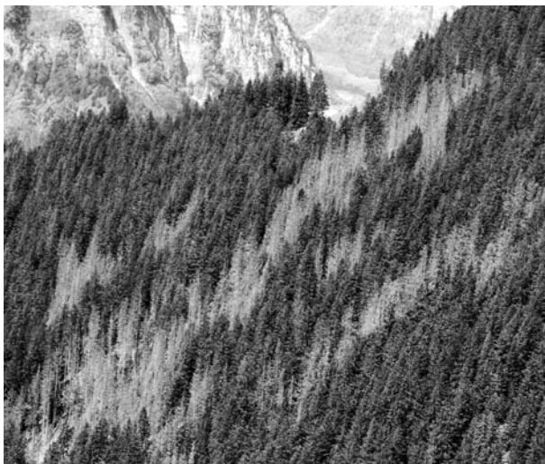
Abb. 2: Ein Befall durch Borkenkäfer erfolgt fast immer fleckenweise. Die Befallsherde können sich ausweiten oder auch erlöschen.

In den kanadischen Rocky Mountains wird beobachtet, dass der Mountain Pine Beetle in die bisher nicht befallenen Gebiete mit Jack Pine