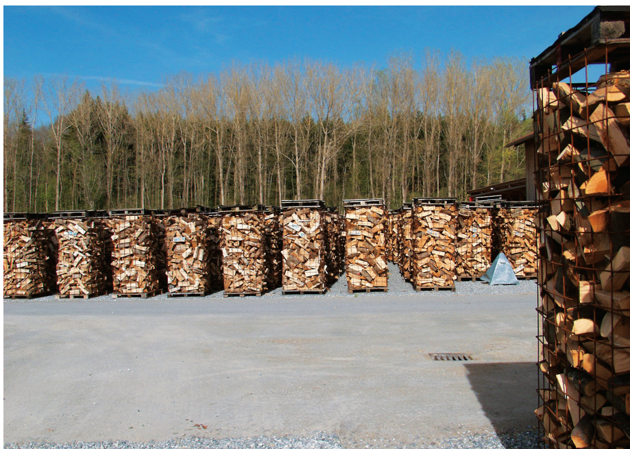
Kommerzielle Holzhändler trocknen das gespaltene Scheitholz aufgrund der besseren Mechanisierbarkeit häufig in einfachen Gitterboxen auf Trockenplätzen.

Die unterschiedlichen Aufarbeitungsformen beziehungsweise -ketten für Scheitholz haben dazu geführt, dass sich unterschiedliche Masseinheiten etabliert haben. Da dies immer wieder zu Ungenauigkeiten und Verwirrungen führt, wurden in Tabelle 1 die wichtigsten Masseinheiten sowie die hier verwendeten Umrechnungswerte zusammengefasst.