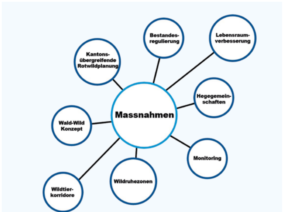
Abb. 1: Die Massnahmen des Rotwildkonzeptes 2017

Zusammenarbeit mit den verschiedenen Interessengruppen im Jahr 2017 ein Rotwildkonzept erarbeitet. Die natürliche Einwanderung des Rothirsches wird zugelassen aber nicht aktiv gefördert. Zusätzlich wurden Massnahmen zur Schadenverminderung und Entschärfung der Interessenskonflikte getroffen (vgl. Abb. 1).