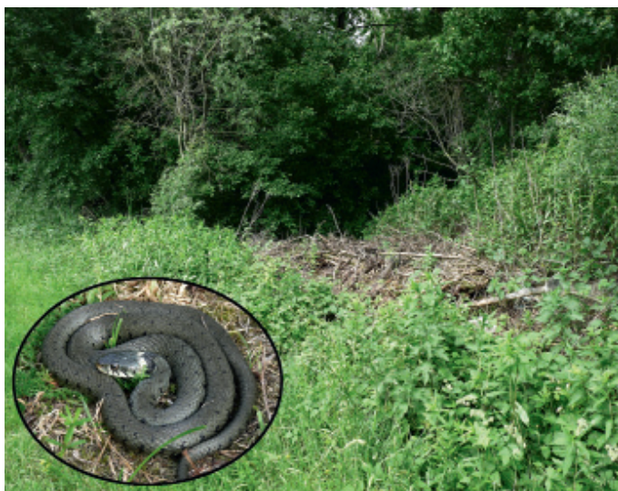
Les lisières structurées et ensoleillées font partie des meilleurs habitats pour les reptiles. Avec un peu de chance, on peut y apercevoir des couleuvres à collier (fig. 3).

La forêt suisse croît essentiellement sur des sols riches permettant naturellement l'apparition de peuplements denses et ombragés. Dans ces forêts, peu de rayons solaires atteignent le sol en été. Les reptiles y sont donc rares et n'apparaissent qu'à l'occasion de perturbations de grande ampleur mettant en lumière d'importantes surfaces (chablis, crues ou avalanches). Les ouragans comme Lothar, en 1999, représentent donc des bénédictions pour ces animaux à sang froid (fig. 5). De nombreuses surfaces versées