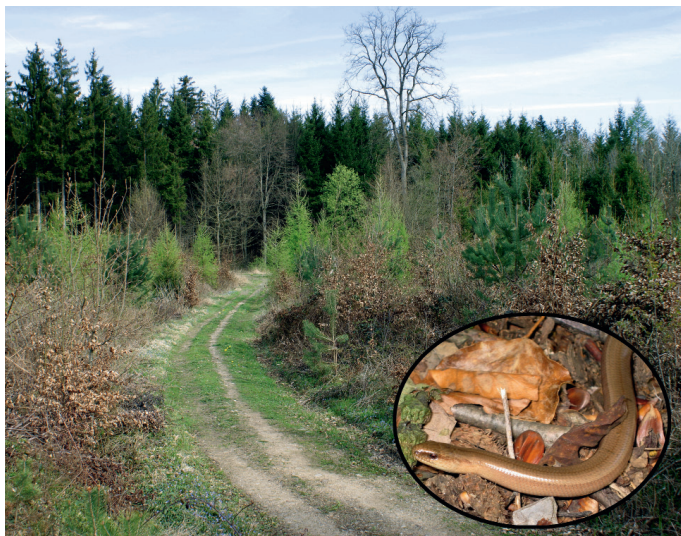
Les chablis sont parmi les seules surfaces forestières du Plateau où les rayons du soleil atteignent le sol: une chance pour de nombreuses espèces, dont l'orvet (fig. 5).