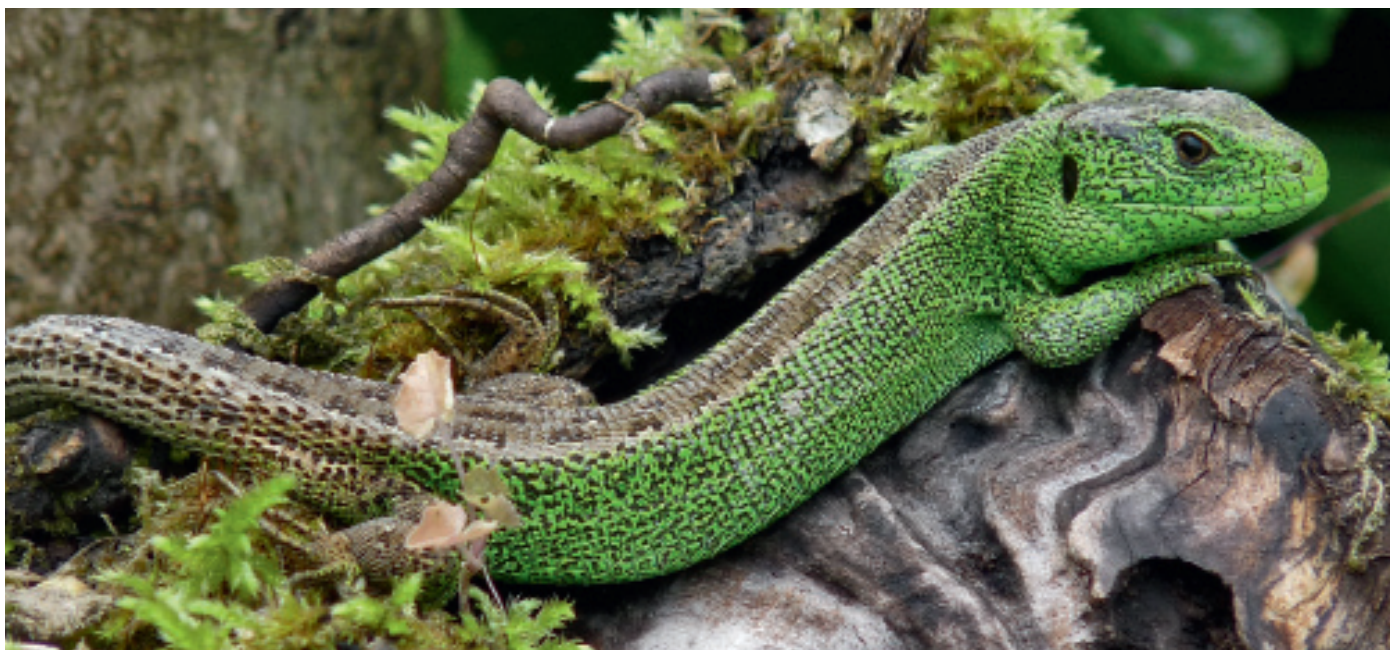
Le lézard agile était largement distribué sur le Plateau suisse. Il est aujourd'hui beaucoup plus rare en raison de la perte de ses habitats et de la prédation par les chats domestiques.

en forêt, il est particulièrement important que l'insolation soit maximale après leur repos hivernal.