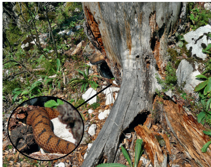
Une vipère aspic prend un bain de soleil sur une vieille souche qui lui sert de refuge. Avant la coupe, cette souche était à l'ombre et trop fraîche pour les reptiles (fig. 6).

par la tempête il y a maintenant 12 ans constituent aujourd'hui encore des habitats de choix pour les reptiles.