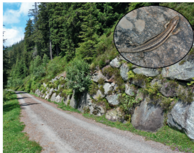
Les talus situés le long des routes forestières et stabilisés par des enrochements ou des gabions offrent aux reptiles des sites d'insolation et des refuges (fig. 4).