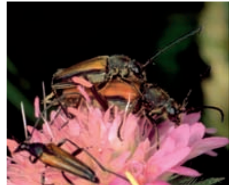
Abb. 17. Verschiedene kleine Bockkäferarten wie diese Anastrangalia dubia brauchen für die Eireifung Blütenpollen.