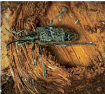
Abb. 18. Dieser Spürende Zangenbock ( Rhagium inquisitor ) hat den Winter in seiner Verpuppungswiege verbracht und verlässt nun den Fichtenstamm.

Walensees gefunden werden. Alte Funde gab es sogar am Buchberg am oberen Zürichsee.