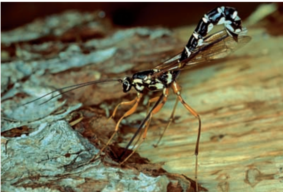
Abb. 11. Die Riesenschlupfwespe ( Rhyssa persuasoria ) ist einer unserer grössten Hautflügler. Sie treibt ihren langen, dünnen Legestachel (zwischen den Mittelbeinen sichtbar) ins Holz und belegt Larven von Holzwespen (vgl. Abb. 23) mit einem Ei. Die schlüpfende, parasitische Larve frisst ihren Wirt allmählich auf.

beispielsweise die Fichtenböcke ( Tetropium ) oder die grossen Monochamus -Arten. Bereits trockeneres Nadelholz wird von den Scheibenböcken ( Callidium , Phymatodes ) bevorzugt. Diese schlüpfen bisweilen aus in Wohnräumen gelagertem Brennholz aus. Glänzende Kleinode sind die Prachtkäfer. Die oft an Holzzäunen sichtbaren, geschlängelten und scharf geschnittenen Frassgänge sind das Werk ihrer Larven. Auch auf Holzlagern sind sie regelmässig anzutreffen. Typische Laubholzbesiedler sind die wespenartig gezeichneten Widder- oder Wespenböcke ( Chlorophorus , Clytus , Xylotrechus ) oder die schillernden Moschusböcke ( Aromia moschata ) und Lindenprachtkäfer ( Scintillatrix rutilans ). Die kleineren Hals- und Schmalböcke ( Anastrangalia , Corymbia , Leptura , Stenurella ) sitzen häufig auf farbigen Blüten, wo sie den für die Geschlechtsreife benötigten Pollen fressen. Die Zangenböcke ( Rhagium ) verpuppen sich nach der zweijährigen Entwicklung in typischen ovalen «Wiegen» aus Holzspänen unter der Rinde von Nadel- oder Laubbäumen. Beim Ablösen alter Rinde deuten diese Spanwiegen noch lange auf ihre Erzeuger hin. Ein besonders schöner, sehr seltener Laubholz-Bockkäfer, der Alpenbock ( Rosalia alpina ), entwickelt sich in alten, verpilzten Buchenstämmen. Er ist in ganz Europa geschützt und gilt in den Ländern, wo er noch vorkommt, als vom Aussterben bedroht. Eine der grössten Populationen in der Schweiz lebt im unteren Prättigau, wobei vereinzelte Käfer bis ins Gebiet des