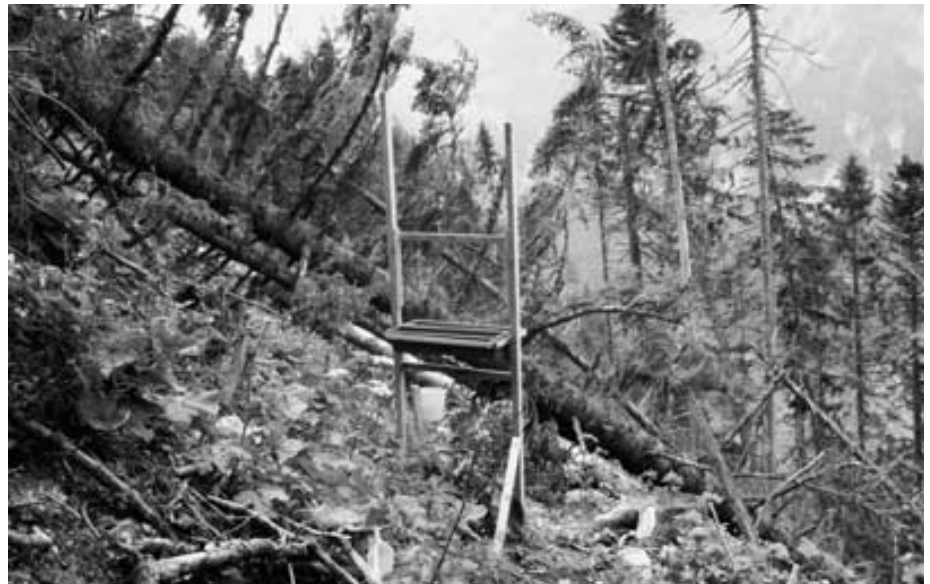
Abb. 24: Versuchsfläche in Pfäfers, wo in einem Windwurf die Auswirkungen des Sturms Vivian auf die Insektenfauna untersucht werden.

Während Urwälder zwischen 50 und 200 Kubikmeter Totholz pro Hektare enthalten, sind es nach dem letzten schweizerischen Landesforstinventar von 1999 in den Schweizer Wäldern durchschnittlich 12,5 Kubikmeter, in den Alpen immerhin 20 Kubikmeter. Häufig herrscht landläufig noch die Meinung vor, dass der Wald aus ästhetischen und forstschützerischen Gründen vom Totholz gesäubert