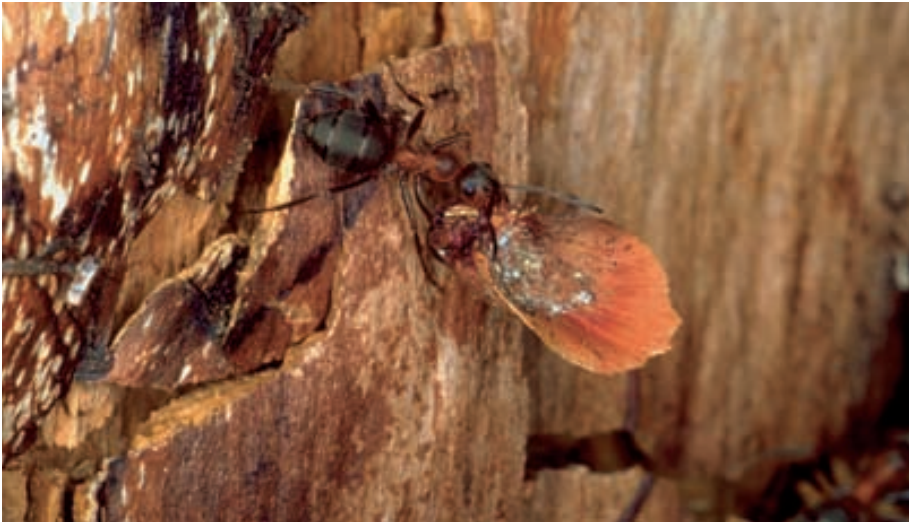
Abb. 3. Eine Waldameise ( Formica-rufa -Gruppe) schleppt die Schuppe eines Lärchenzapfens ins Nest.

Pflanzenmaterial gelangt in Form von Kot der Tiere schon stark abgebaut auf den Boden. Diese Ausscheidungen werden sehr schnell von Mikroorganismen besiedelt und mineralisiert. Das führt zu einer schnelleren Verfügbarkeit der Nährstoffe für das Pflanzenwachstum.