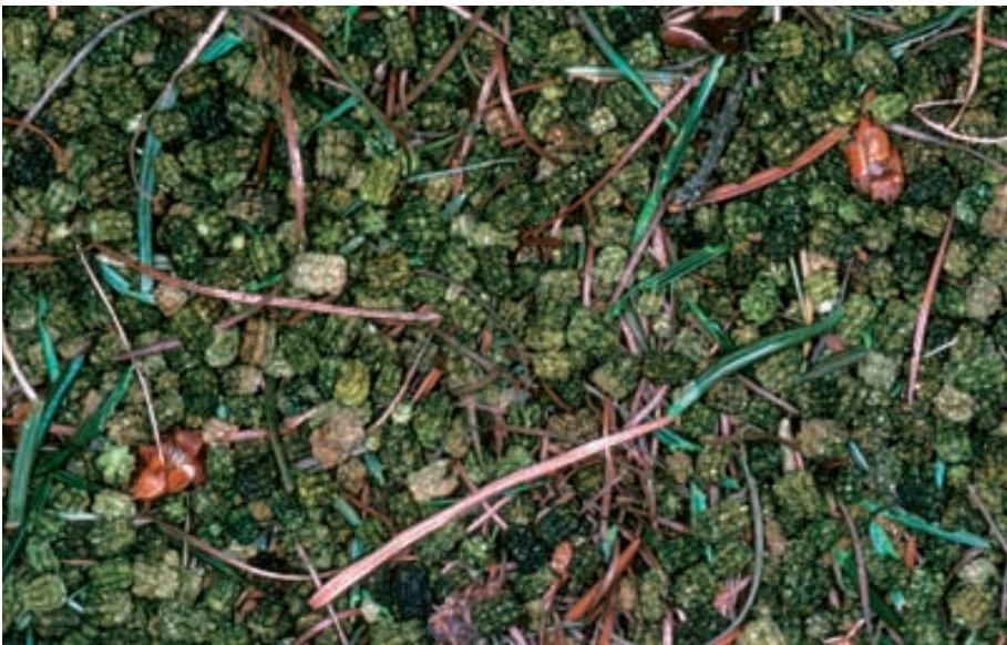
Abb. 4. Nach einer starken Vermehrung des Nonnenspinners ( Lymantria monacha ) in einem Lärchenwald kann der ganze Waldboden mit einer dicken Schicht Kot bedeckt sein. Dieser ist schneller abbaubar als die ursprünglichen Nadeln, was den Nährstoffkreislauf beschleunigt.

der Rinde und im Holz gespeicherten Nährstoffe und die Energie müssen dem Boden wieder verfügbar gemacht werden. Für Mikroorganismen ist der Abbau von Holz schwieriger als von Blättern oder Krautpflanzen. Die schwer zu besiedelnde Rinde schützt den darunter liegenden Holzkörper vor dem Abbau durch Pilze. Frisch abgestorbenes Holz wird von einer Vielzahl von spezialisierten Pionierinsekten besiedelt. Sie bohren Löcher in die Rinde oder bis ins Holz und machen dieses Substrat für weitere holz- und rindenfressende Insekten und für