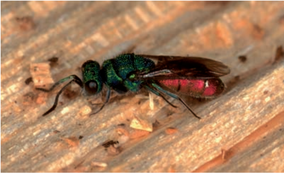
Abb. 22: Eine parasitische Feurgoldwespe ( Chrysis ignita ) sucht ein Scheit auf einer Holzbeige nach einem Loch ab, in dem eine Solitärwespe ihre Brut angelegt hat.