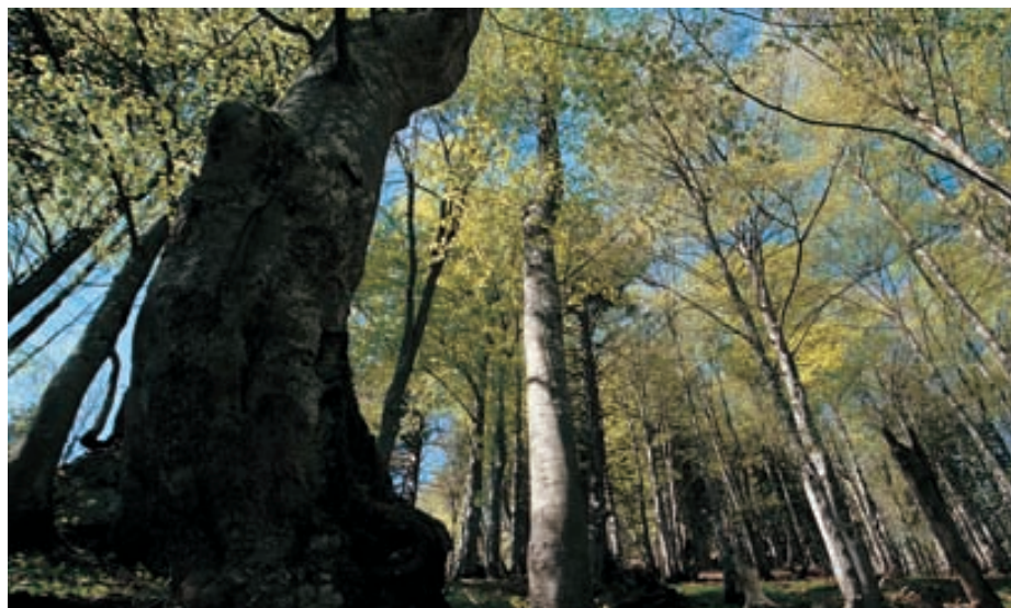
Abb. 20: Bei genügendem Angebot an Buchenthoholz müsste der Alpenbock auch in den Buchenwäldern des Forstkreises Werdenberg vorkommen.