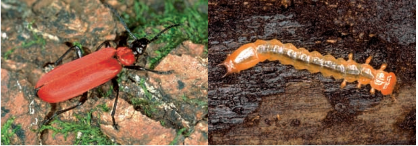
Abb. 10. Der Scharlachrote Feuerkäfer ( Pyrochroa coccinea ) ist ein räuberischer Totholzbewohner. Seine Larve ernährt sich während ihrer zweijährigen Entwicklung unter der Rinde von anderen Insekten, zum Beispiel Borken- oder Bockkäferlarven.

sitische Schlupfwespen. Einige typische xylobionte Insektengruppen sind im Folgenden dargestellt.