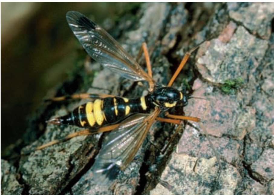
Abb. 7. Diese Ctenophora-festiva -Schnake hat sich in einem abgestorbenen Weidenast entwickelt.

Milben und Springschwänze im Holzmulm. Die eigentlichen Bodenlebewesen (Würmer, Schnecken, Asseln, verschiedene Insekten) steigen in das Moderholz auf. Diese Fauna zerkleinert die Partikel und vergrössert damit die angreifbare Oberfläche für Mikroben, welche den eigentlichen Abbau von Zellulose, Hemicellulose, Lignin und Pektin vornehmen. Das Holz wird schliesslich zu Rohhumus und zu «Boden».