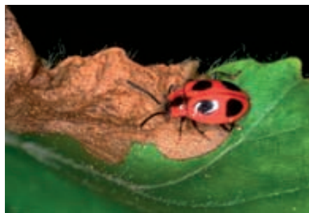
Abb. 21: Der Scharlachrote Pilzkäfer ( Endomychus coccineus ) entwickelt sich in feuchten Wäldern unter verpilzter Rinde oder in Baumpilzen.

Gründung solcher Nester sucht die Ameisenkönigin ein Volk von Hilfsameisen ( Serviformica ), deren Königin von der Formica-Königin getötet wird. Die mutterlosen Hilfsameisen ziehen dann die Nachkommen der Formica-Königin auf, die schliesslich die Funktion der Hilfsameisen übernehmen. Die grossen Rossameisen ( Camponotus ) nisten häufig in totem Nadel- und Laubholz und zerfressen dabei das Holzinnere völlig. Auch die Glänzendschwarze Holzameise ( Lasius fuliginosus ) baut ihre Kartonnester in hohlen Baumstämmen.