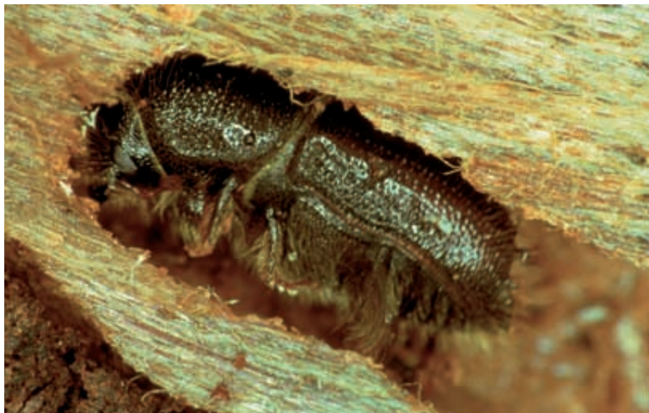
Abb. 9. Der Buchdrucker ist einer der wenigen Borkenkäfer, die unter günstigen Bedingungen auch auf lebende Bäume übergehen und diese zum Absterben bringen können.

tion in die Länge ziehen. In Zeiten der sogenannten Latenz, das heisst bei niederen Dichten, ist der Buchdrucker als natürlicher