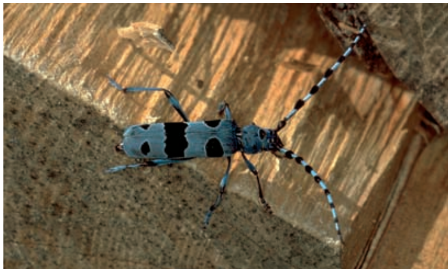
Abb. 19. Der lateinische Name des Alpenbocks, Rosalia alpina , passt zum wunderschön gefärbten, stattlichen Käfer. Die Entwicklung erfolgt in altem Buchenholz. Vor rund zehn Jahren wurde er letztmals auch im Raum Sargans beobachtet.

Die grossen Nesthaufen der unter Schutz stehenden Roten Waldameisen der Gattung Formica sind wohlbekannt. Für die