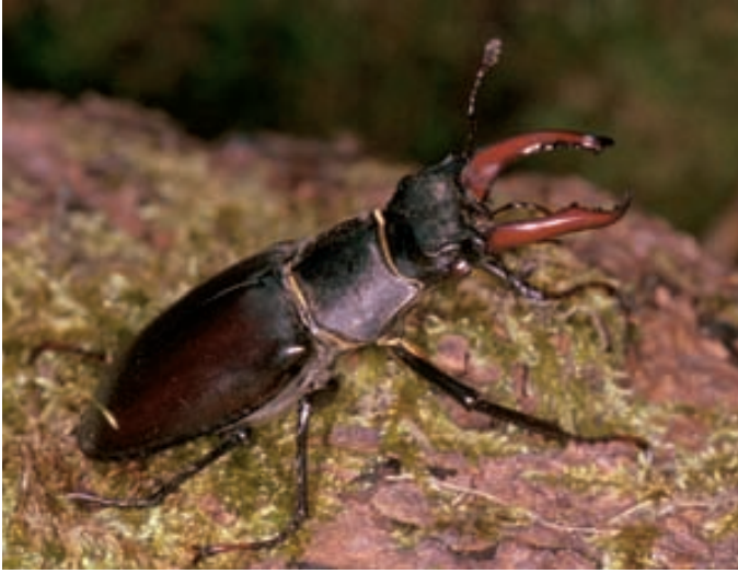
Abb. 6. Der Hirschkäfer ( Lucanus cervus ) braucht für seine Entwicklung in morschem Eichenholz fünf bis acht Jahre. Er ist in der Schweiz geschützt.