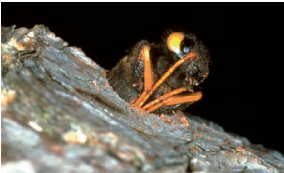
Abb. 23: Eine Riesenholzwespe ( Urocerus gigas ) bohrt sich nach dreijähriger Entwicklung aus einem toten Fichtenstamm.