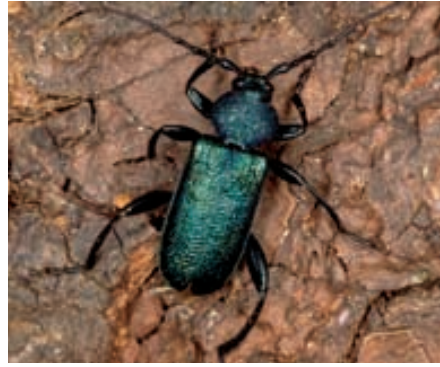
Abb. 13. Die Larve des metallisch gefärbten Blauen Scheibenbocks ( Callidium violaceum ) frisst während zwei Jahren unter der Rinde trockenem Nadelholzes.