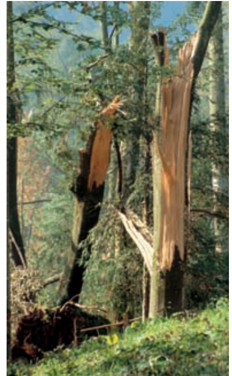
Abb. 5. Eine vom Sturm gebrochene Buche kann über viele Jahre hinweg Brut- und Lebensraum für zahlreiche Insekten und andere Tiere bieten.

Pilze zugänglich. Auch ihr Genagsel und ihr Kot können viel besser durch Mikroorganismen abgebaut werden als das noch feste Holz. Der Abbau eines Stammes nur durch Mikroben allein würde doppelt so lange dauern wie mit Hilfe der Holzinsekten.