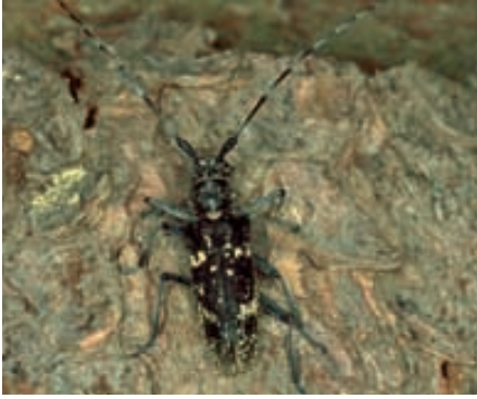
Abb. 12. Bockkäfer haben ihren Namen von den langen Fühlern, die zum Beispiel an einen Steinbock erinnern. Der Schneiderbock ( Monochamus sartor ) legt seine Eier auf frisch abgestorbenes Nadelholz. Seine Larven fressen zuerst in der Rinde und nagen sich zur Verpuppung ins Splintholz.