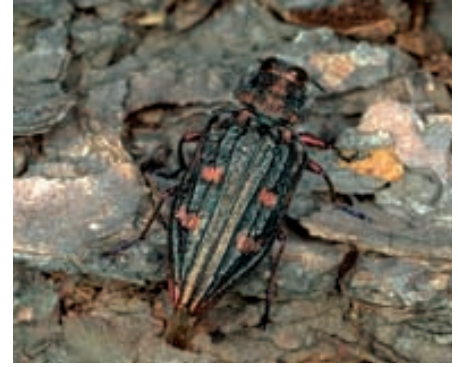
Abb. 14: Vom Goldgrubenprachtkäfer gibt es eine Art im Laubholz und eine im Nadelholz. Chrysobothris chrysostigma , hier bei der Eiablage, besiedelt in höheren Lagen Stämme von Nadelbäumen.