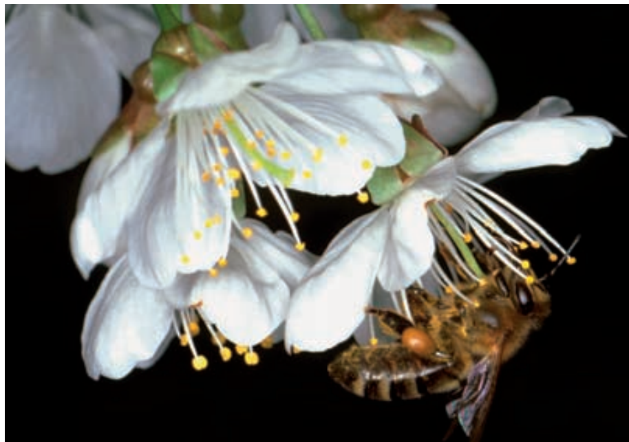
Abb. 2. Die Kirsche ist eine der Baumarten, die grosse, attraktive Blüten bilden, um Insekten wie die Honigbiene ( Apis mellifera ) für die Bestäubung anzulocken.

Rund 80 Prozent aller Bäume und Sträucher werden von Insekten bestäubt. Im Wald vermehren sich zwar viele Baumarten mit Hilfe von Windbestäubung, einige aber investieren viel Energie in grosse, mit Nektar lockende Blüten. Beispiele dafür sind Ahorn, Hartriegel, Weissdorn, Rosskastanie, Kirsche, Kreuzdorn, Weide,