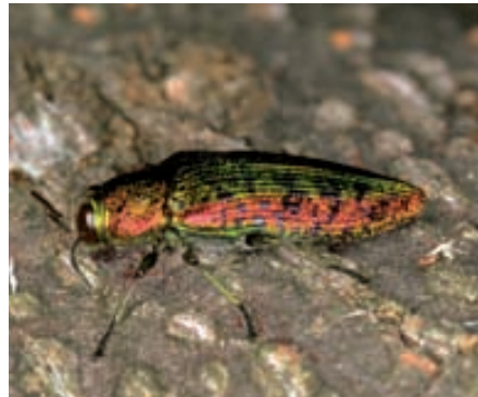
Abb. 16. Einer der schönsten Prachtkäfer ist der Lindenprachtkäfer ( Scintillatrix rutilans ). Er ist für seine Entwicklung an tote Linden gebunden.