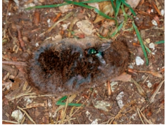
Abb. 8. Die Larven der Goldfliegen entwickeln sich in Aas und sorgen mit vielen anderen Aasverwertern dafür, dass Kot und Kadaver schnell abgebaut werden.

ihrer Bohrtätigkeit das Substrat Holz für den weiteren Abbau. Diese Besiedlungsphase dauert normalerweise ein bis zwei Jahre.