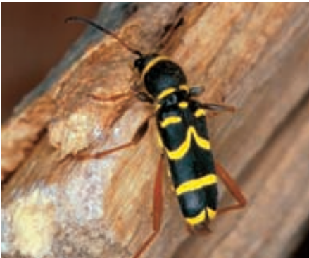
Abb. 15. Den Gemeinen Widderbock ( Clytus arietis ) kann man häufig auf Buchenholzbeigen beobachten, wo er geeignete Orte für die Eiablage sucht.