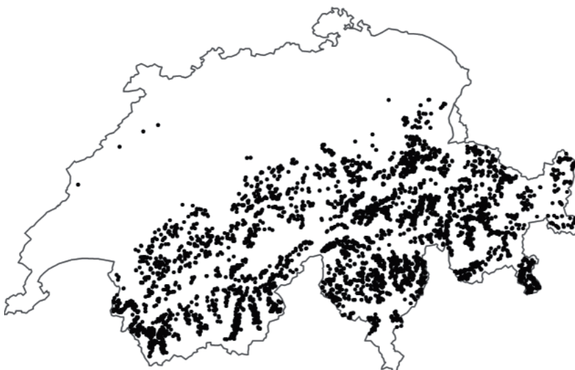
Abb. 1: Waldausdehnung in Lawinanrissgebieten. Die Punkte stellen Stichprobenflächen der CH-Arealstatistik dar, wo im Zeitraum zwischen 1985 und 1997 in potenziellen Lawinanrissgebieten neuer Schutzwald entstanden ist.

In einer GIS-gestützten Analyse wurden Waldveränderungen zwischen den beiden letzten Inventurperioden der Schweizerischen Arealstatistik 1979 bis 1985 und 1992 bis 1997 für alle Berggebietsflächen der Schweiz oberhalb von 1200 m ü. M. erfasst (Abb. 1). Dabei wurden auf jeder Hektare die Kategorien «dichter Wald» (Deckungs-