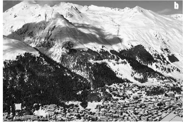
Abb. 2a und b: Waldveränderungen oberhalb Davos zwischen 1945 und 2007.

grad >60 %, Baumhöhe >3 m), «offener Wald» (Deckungsgrad 20–60 %, Baumhöhe >3 m) und «Nichtwald» (DG <20 %) unterschieden. Anschliessend wurden die Waldveränderungen mit modellierten potenziellen Lawinanrisszonen in und ausserhalb des Waldgebietes (Gruber et al. 2007) sowie anderen Umweltfaktoren wie «Höhe über Meer», «Steilheit» oder «Distanz von der oberen regionalen Baumgrenze» in Beziehung gesetzt und statistisch ausgewertet.