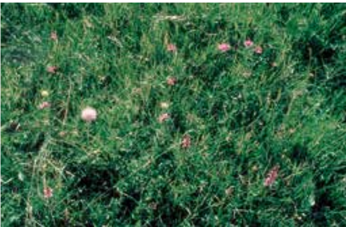
Artenreiche Magerwiese vor ...