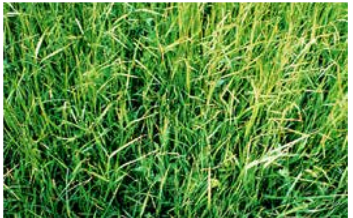
... und zwei Jahre nach einer Düngung.