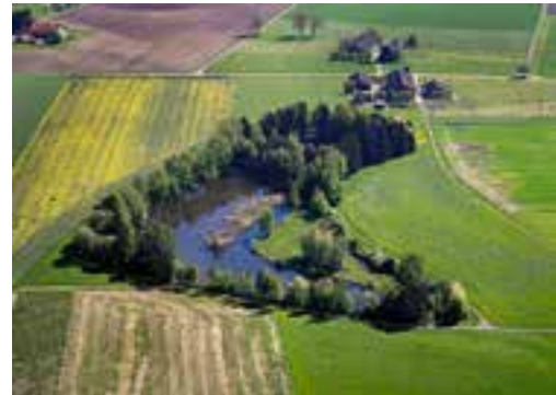
Isoliertes Schutzgebiet, umgeben von intensiv genutzten Feldern und Wiesen.