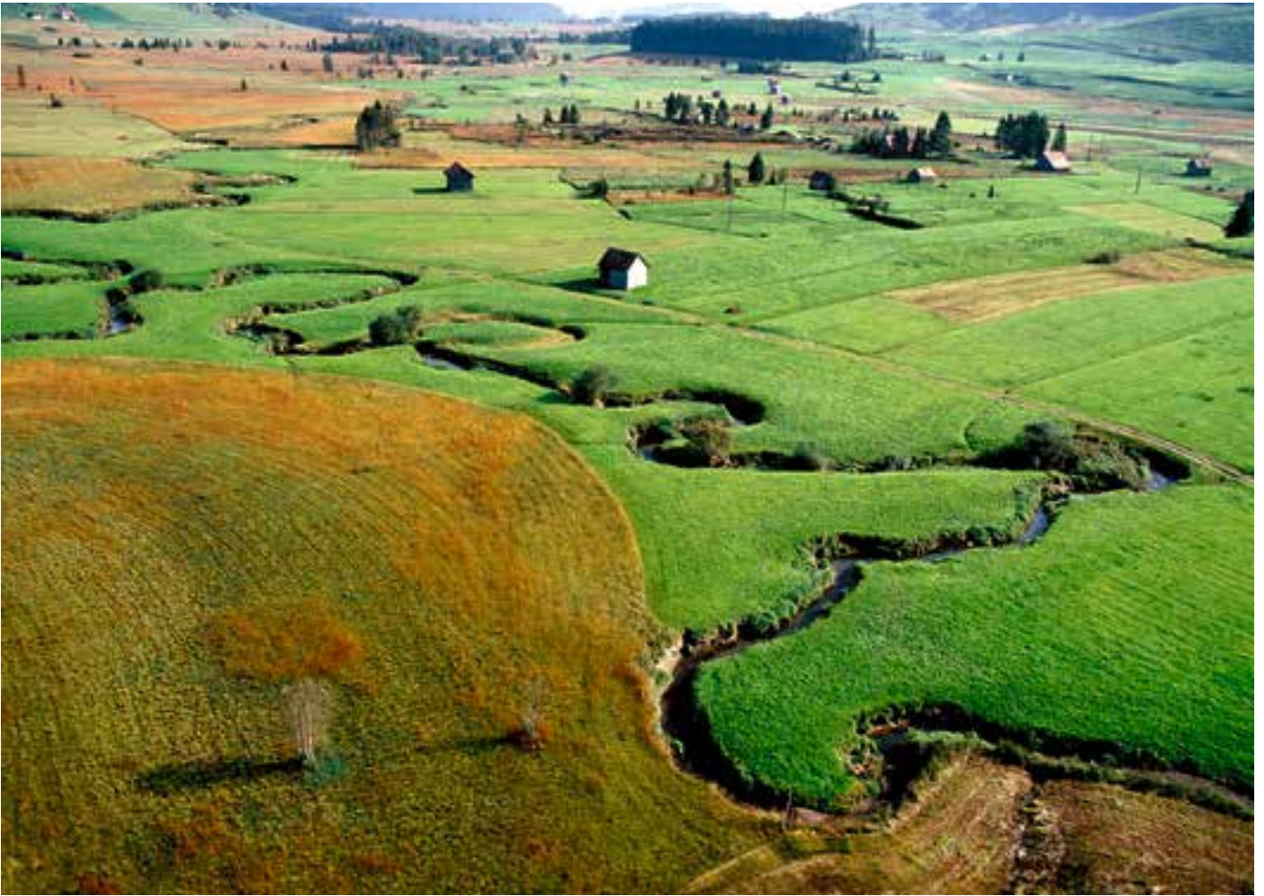
Im Hochtal von Rothenthurm (SZ) wechseln sich im Herbst saftig grüne (aber artenarme) Intensivwiesen mosaikartig mit artenreichen, wenig oder gar nicht gedüngten Wiesen (in verschiedenen Rot- und Brauntönen) ab.