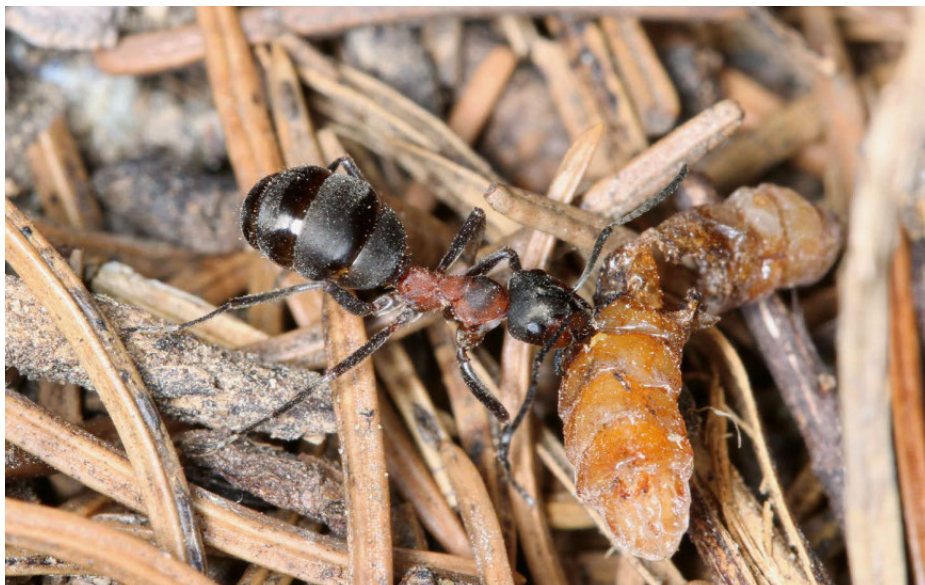
Les fourmis nourrissent leur couvain avec des insectes et peuvent, de la sorte, capturer une quantité gigantesque de ravageurs.