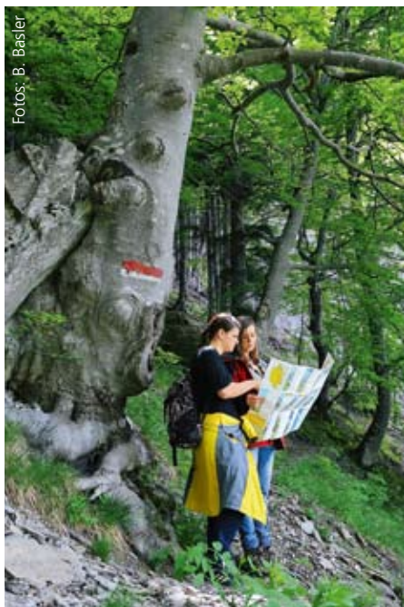
Wandern im Wald ist überall beliebt – hier sind die regionalen Unterschiede am kleinsten.