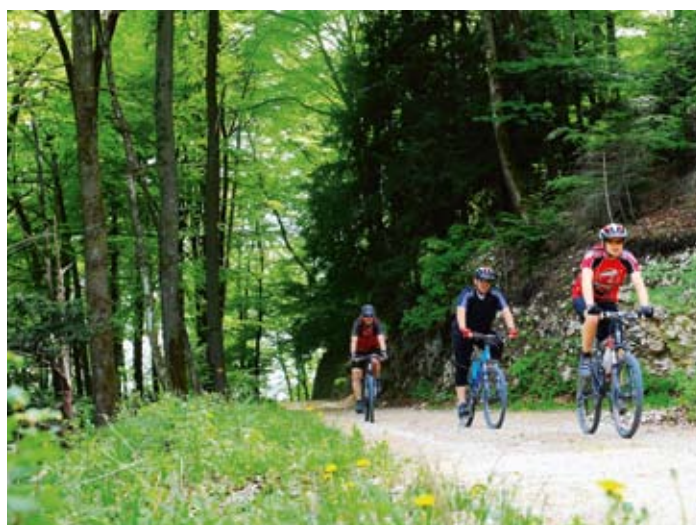
Erholung im Wald spielt sich zur Hauptsache auf Wegen und Strassen ab.

Das LFI hat drei methodische Standbeine: Die Fernerkundung, die Felddaufnahmen und die Umfragen beim Forstdienst. Bei der Befragung der zuständigen Revierförster wurden im LFI3 Daten zu den folgenden Themen erhoben: Planung (Eigentum, Waldfunktionen, Zertifizierung, nächster Eingriff, Grösse der Bewirtschaftungseinheit, betriebliche Planungsgrundlagen), Waldnutzung (letzter Eingriff, Zwangsnutzungen, Beweidung, Trinkwasser-Quellen sowie Intensität, Saisonalität und Art der Erholungsnutzung), Waldentstehung (Art der Wald- und Bestandesentstehung), Waldschäden (Art und Jahr der Flächenschäden) und Holzerntetechnik (Ausführung der Holzernte, Art der Baumernte, Rückverfahren). Zusätzlich wurden das LFI-Waldstrassennetz nachgeführt und Neubauten, Ausbauten, Belagswechsel und Rückbauten erfasst.