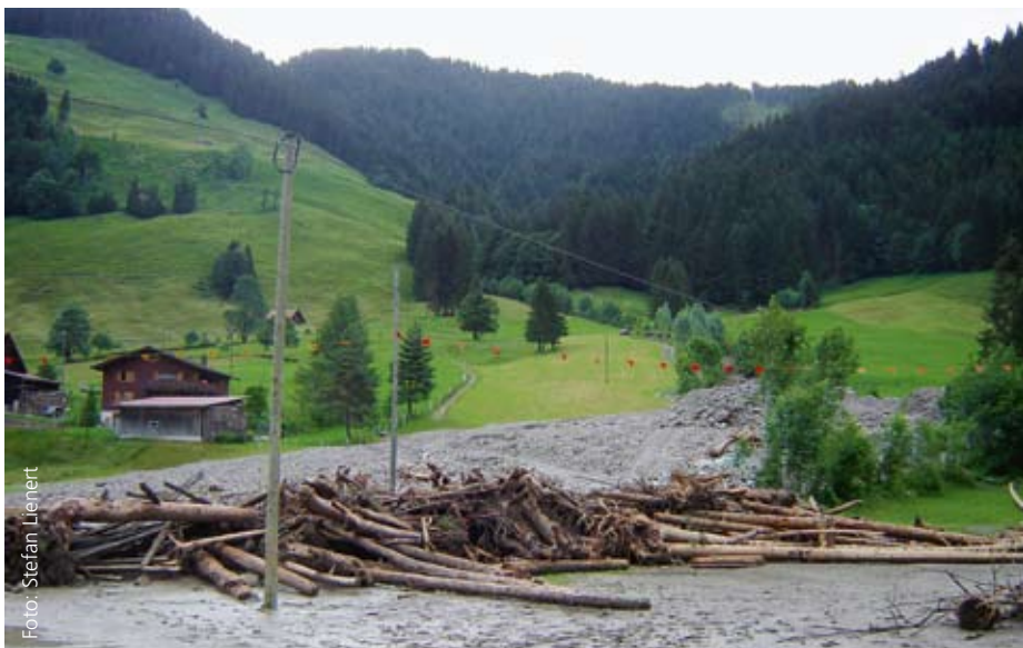
Alpthal/SZ nach dem Unwetter vom 20./21. Juni 2007: Selbst kleine Bäche können bei Unwettern gewaltige Massen Schutt und Holz auf das Kulturland schwemmen.

«Nicht jeder Stamm im Bach ist gefährlich.» Totes Holz in einem Bach bildet einen wertvollen Lebensraum für Kleintiere und Amphibien. Es hat auch eine wichtige Brückenfunktion zwischen den einzelnen Biotopen des Ökosystems. In einem intakten Fließgewässer gehören die Prozesse Eintrag, Transport, Ablagerung und Abbau von Totholz zur natürlichen Gewässerdynamik. Dies gilt insbesondere für langsam fließende Gewässer,