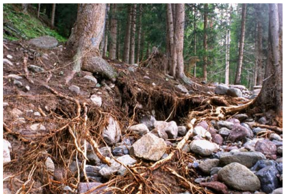
Der Chummerbach in der Landschaft Davos: Die Baumwurzeln armieren den Boden und reduzieren die Gefahr von Erosion und Rutschungen.

Stellen. Der Kanton Luzern beispielsweise hat im Rahmen seines Projektes «Nachhaltiger Schutzwald entlang von