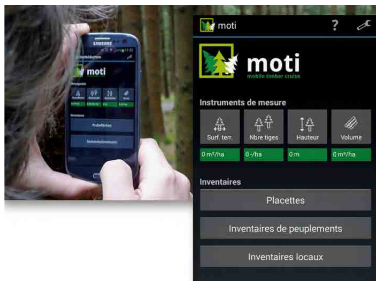
Figure 2: Interface principale de MOTI: instruments de mesures, modes d'inventaires et paramètres de l'application.

MOTI est une application pour smartphone qui permet en quelques clics de chiffrer concrètement ce que l'on voit en forêt, en particulier le matériel sur pied, la hauteur des arbres, la surface terrière, le nombre de tiges à l'hectare et l'accroissement. Essayez, par exemple, d'estimer ces valeurs à partir de la figure 1, en prenant comme référence la personne au centre de la photo. Vous trouverez la réponse dans cet article.