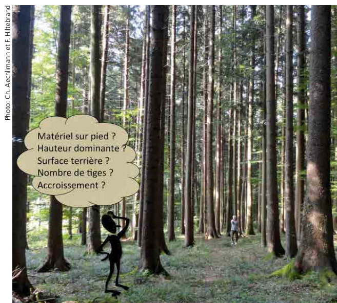
Figure 1: Photo d'une pessière prise par deux étudiants dans le cadre d'un travail d'étude autonome.