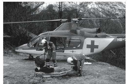
Figure 4: déterminer les coordonnées pour un éventuel secours aérien.