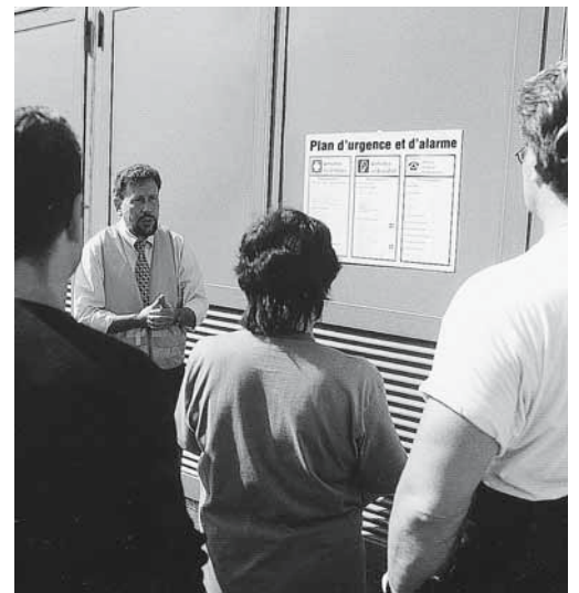
Figure 3: il est de la responsabilité des cadres d'assurer l'instruction des collaborateurs.