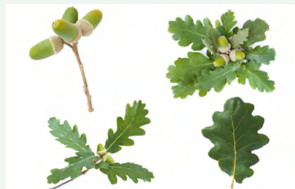
Frucht und Blatt der Flaumeiche